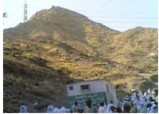
▲ Sevr Dağı