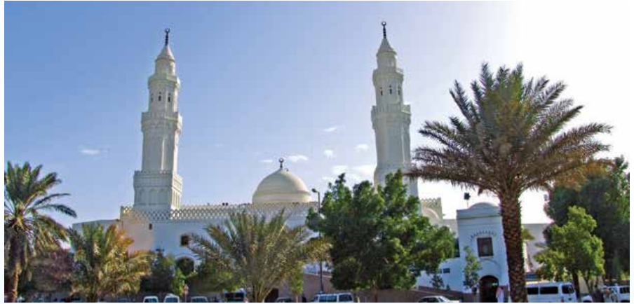
Kibleteyn Mescidi ▶