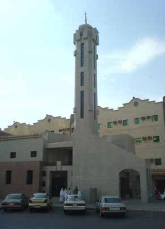
▲ Cın Mescidi