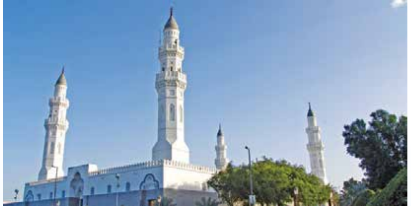
Kuba Mescidi ▶