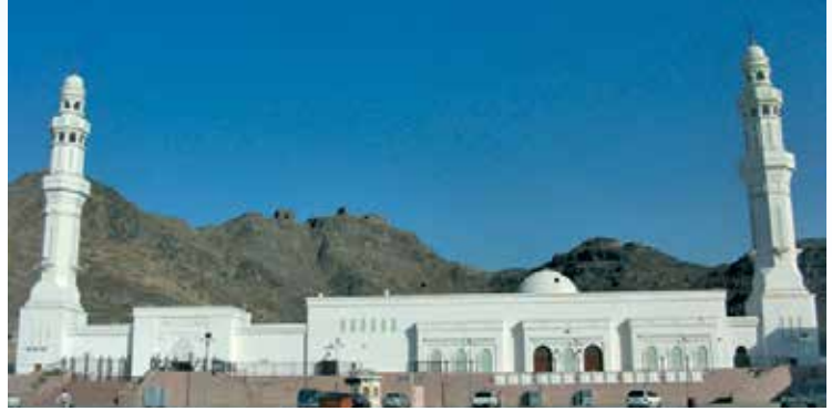
Yedi Mescitler ▶