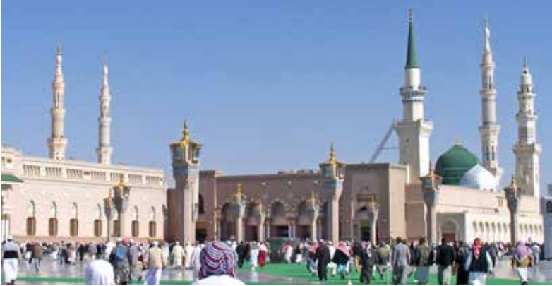
◀ Mescid-i Nebevi