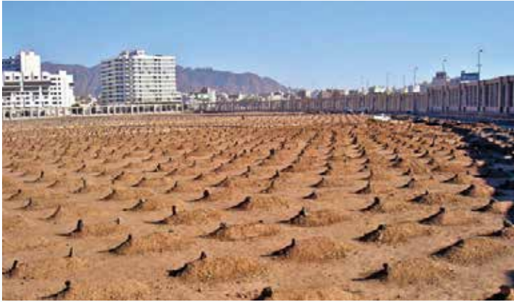
◀ Cennetü'l Baki Kabristanı