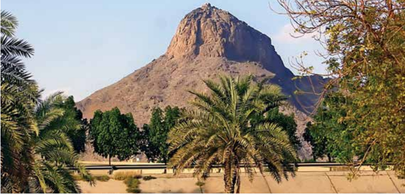
◀ Nur Dağı (Hira Mağarası)