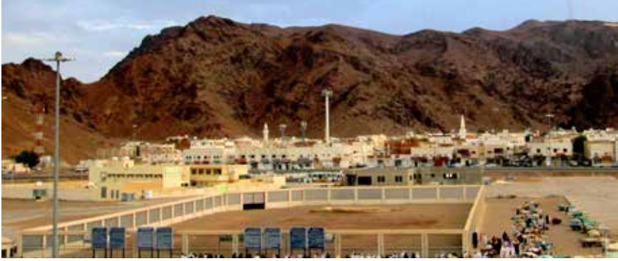
◀ Uhud Şehitliği